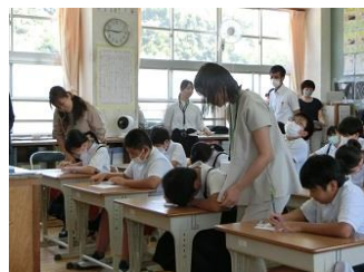
9/29 県がん教育等外部講師 連携推進事業 「がん教育授業研修会」〈5年〉