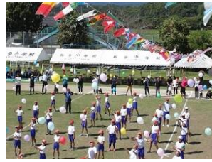
130周年記念パルーンリリース