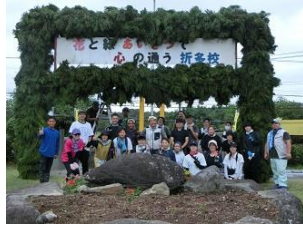
4年ぶりの緑門完成