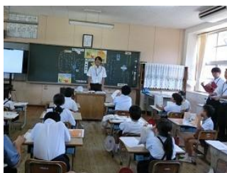
10/6 地区フレッシュ研修 (道徳) 授業校〈2年〉