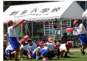
たいふ〜んの目 (上学年)