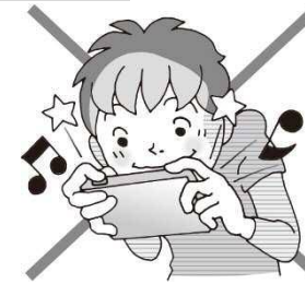
画面に近すぎない