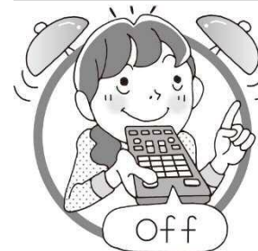
時間を決めておく