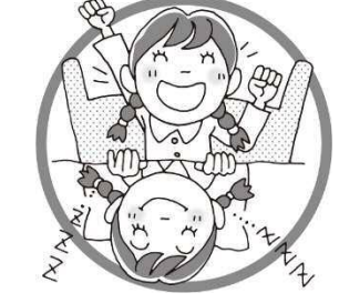
しっかりと睡眠をとる