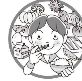
バランスのよい食事をする