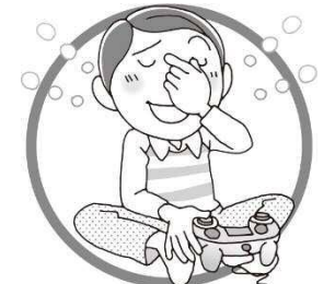
ときどき休けいをとる